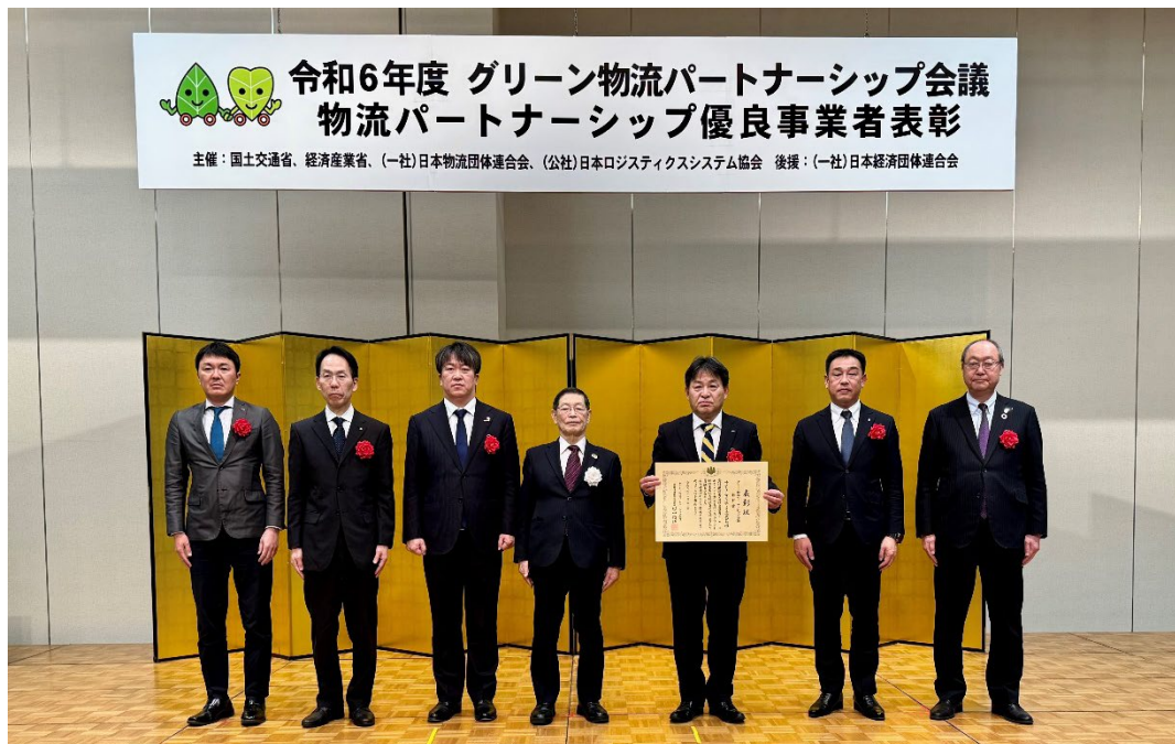
<12月23日の表彰式の様子>

今回の受賞は、異業種メーカーの協業によるリレー輸送（乗務員交代方式）を活用した往復輸送を実施し、定期運行が可能になることで、輸送能力の確保と効率化、CO 2 排出量削減、乗務員の負担軽減（日帰り運行・定時運行）に貢献したことが高く評価されました。当社は、円滑にリレー輸送が行えるよう物流センターの運用・体制整備を行いました。